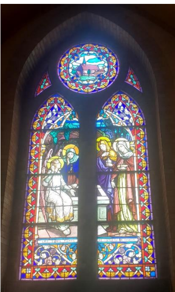
Les trois Maries au tombant du Christ