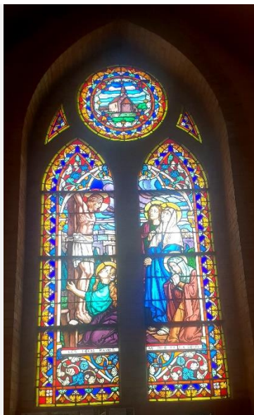
Les trois Maries au pied de la croix