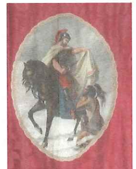
détail de la bannière conservée à la sacristie

Comme toutes les églises, cette église de Pré-Saint-Martin est placée sous le patronage d'un saint protecteur. Il s'agit ici de saint Martin, comme plus de 4.000 autres lieux de culte en France. Martin est l'un des saints les plus populaires de notre pays. Ceci explique que 236 communes de France portent son nom et qu'il soit devenu le patronyme le plus répandu. Le geste qu'il eût, alors qu'il était en garnison à Amiens en 337, de couper son manteau en deux pour couvrir un pauvre qui mourait de froid, a frappé les imaginations et a franchi les frontières et les siècles sous la forme d'images, de statues et de vitraux. Il doit aussi sa popularité à son extrême humilité : vivant comme un ermite, il se cacha pour échapper à l'épiscopat, mais, pressé de toutes parts, il fut, de force, proclamé évêque de Tours en 370. Saint Martin fut un infatigable évangéliste, il répandit la Bonne Nouvelle du Christ dans la campagne d'une Gaule restée encore très païenne. Il fonda de nombreuses paroisses rurales, notamment Candes-Saint-Martin où il mourut en 397. Sa notoriété est telle qu'un grand nombre de corporations en a fait son