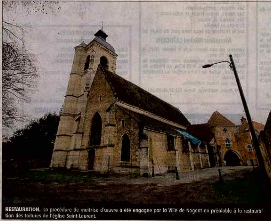
RESTAURATION. La procédure de maîtrise d'œuvre a été engagée par la Ville de Nogent en préalable à la restauration des toitures de l'église Saint-Laurent.